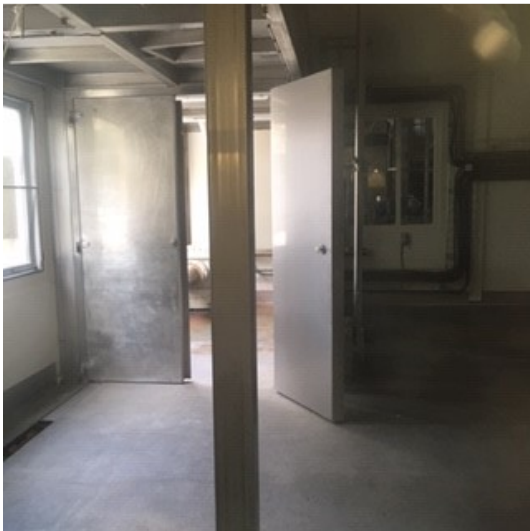
Unit 3 - leegstand