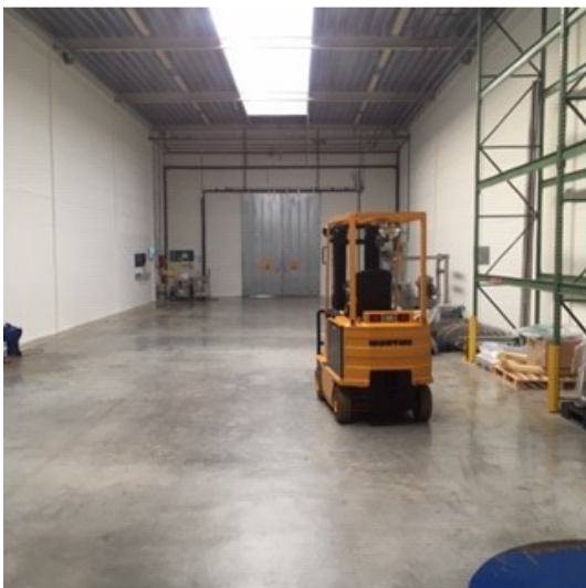
Unit 3 - leegstand