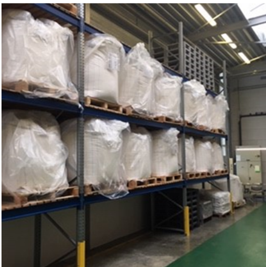
Gereed product - unit 2