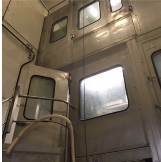
Installatie - unit 2