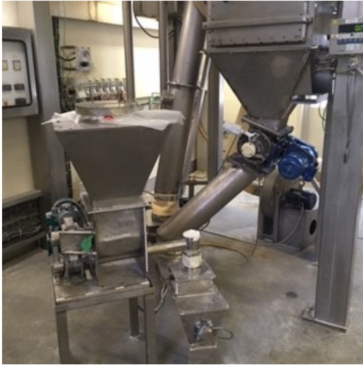
Installatie - unit 2