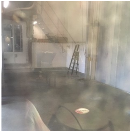
Unit 3 - leegstand