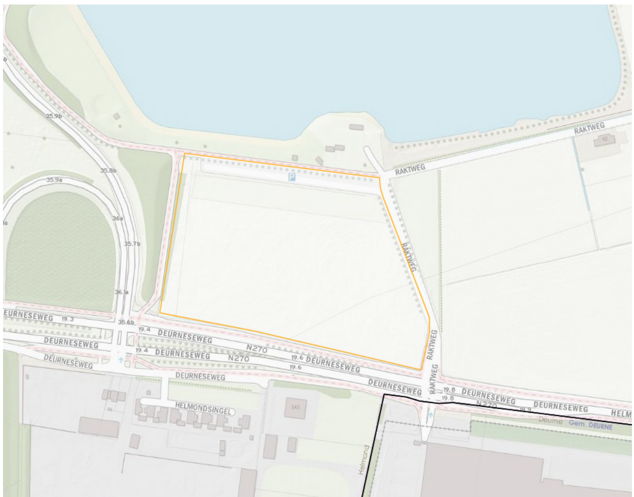
Fig. Ligging planlocatie (oranje contour)